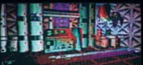
Photos d'écran d'Amstrad CPC